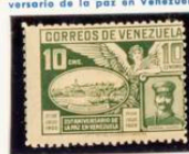
General Gómez y vista de Ciudad Bolívar