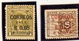
Antonio José de Sucre