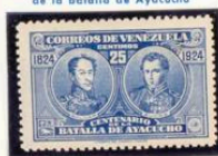
Simón Bolívar y A. J. de Sucre