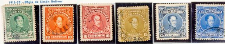
1915-23.—Efigie de Simón Bolívar