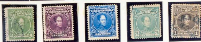
1924-28.—Sellos de 1915-23 con los colores cambiados