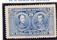
Simón Bolívar y A. J. de Sucre