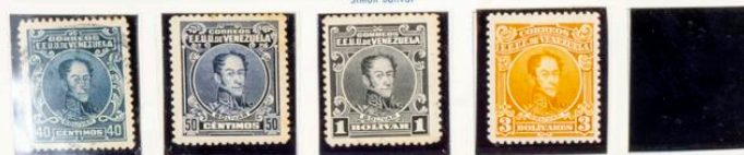
1924.—Conmemorativo del centenario de la batalla de Ayacucho